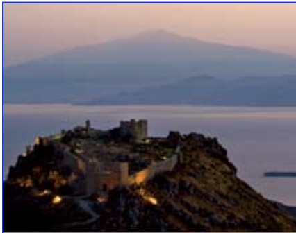
Valorizzazione S. Niceto

l'ingresso della fortezza nei benefici della legge regionale sui castelli; è stato completato l'intervento di arredo per € 100.000 dell'edificio bizantino. Ma in questi quattro anni l'amministrazione è stata anche in prima linea in una lunga vertenza avviata con le ex Ferrovie dello Stato, conclusosi con il riconoscimento per il Comune di oltre 430.000 €.