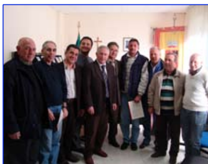
Stabilizzazione di sei lavoratori

Sintetizziamo di seguito i positivi risultati ottenuti in cinque anni di governo locale che hanno consentito: