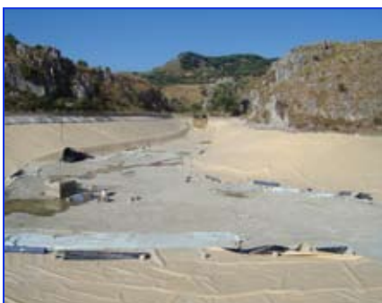
I lavori negli invasi collinari

XII. nel campo agricolo, con i lavori negli invasi collinari (Vena e Scillupia) in sinergia con il Consorzio di Bonifica; XIII. nel campo culturale e dei beni architettonici con progetti inerenti il Museo e l'area archeologica di Lazzaro, il parco S. Niceto; XIV. nel rinnovo del parco macchine (nuovo bus scolastico, navetta per la mobilità sociale e macchina per Polizia Municipale e servizio tecnico);