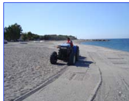
Lavori di protezione costiera

II. nel campo ambientale, con l'avvio del porta a porta, l'avvio dei lavori dell'isola ecologica, la bonifica e messa in sicurezza di parti delle fiumare cittadine San Vincenzo ed Oliveto,