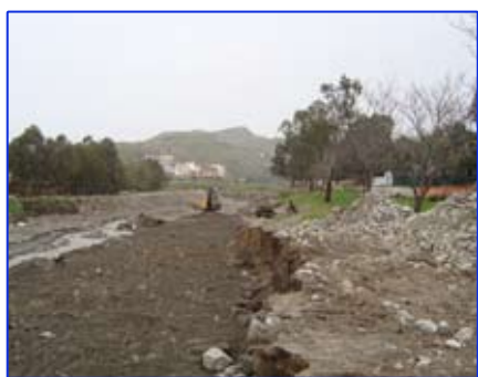
Sistemazione idraulica S. Vincenzo

I. nel campo della protezione costiera, realizzati il I e il II lotto ed in via di realizzazione anche il terzo lotto lungo la via marina di Lazzaro;