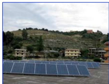
Interventi patrimonio scolastico

VI. nell'ambito dell'edilizia scolastica, con interventi di manutenzione straordinaria nelle scuole cittadine di Motta (scuola media) e di Lazzaro (elementari S.Elia) ed il prossimo avvio dei lavori di completamento nelle