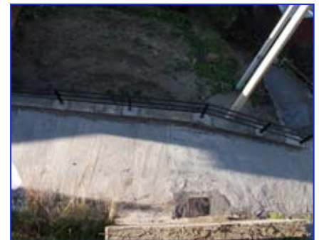
Riapertura strada Surici

scuole di Motta, Lazzaro e Valanidi; VII. nel comparto idrico cittadino (Lazzaro, Motta e Valanidi) con interventi di rifacimento di tratti d'acquedotto, l'avvio della nuova bollettazione, il rifacimento da parte SORICAL di oltre quattro Km di nuova linea dell'acquedotto Tuccio, la formazione di nuovi tratti di rete metano a Lazzaro Vecchio e nelle zone alte di Motta (contrada foresta); VIII. nel campo della viabilità rurale ed interpodereale, mediante contributi comunali finalizzati e l'avvio dei lavori della strada Cimitero - case Martino; IX. la riapertura dopo 20 anni della strada Surici-Provinciale; X. la sistemazione degli spogliatoi nel campo di calcio L. Azzarà; XI. il prossimo avvio dei lavori di sistemazione del versante in frana di località Parco del Minatore di Motta Centro;