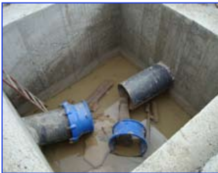
Opere idriche SORICAL

scuole di Motta, Lazzaro e Valanidi; VII. nel comparto idrico cittadino (Lazzaro, Motta e Valanidi) con interventi di rifacimento di tratti d'acquedotto, l'avvio della nuova bollettazione, il rifacimento da parte SORICAL di oltre quattro Km di nuova linea dell'acquedotto Tuccio, la formazione di nuovi tratti di rete metano a Lazzaro Vecchio e nelle zone alte di Motta (contrada foresta); VIII. nel campo della viabilità rurale ed interpodereale, mediante contributi comunali finalizzati e l'avvio dei lavori della strada Cimitero - case Martino; IX. la riapertura dopo 20 anni della strada Surici-Provinciale; X. la sistemazione degli spogliatoi nel campo di calcio L. Azzarà; XI. il prossimo avvio dei lavori di sistemazione del versante in frana di località Parco del Minatore di Motta Centro;